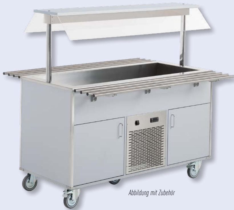
Abbildung mit Zubehör