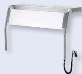
Hustenschutz mit Halogen-Oberhitze