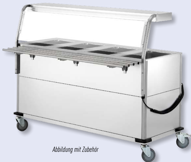
Abbildung mit Zubehör