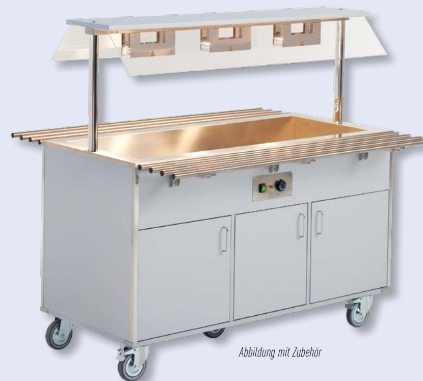
Abbildung mit Zubehör