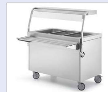
Abbildung mit Durchreiche